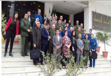
صورة جماعية في نهاية التدريب

في شباط/فبراير، قام المكتب بتدريب ضباط الشرطة وأعضاء قوات الدرك والقضاة والمدعين العامين العاملين مع الأطفال على المعايير الدولية والممارسات الإقليمية والوطنية السليمة في مجال مساعدة وحماية الأطفال ضحايا الجريمة. وأتمت التدريب بعدة توصيات منها: