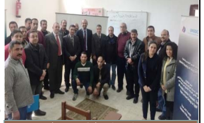
تدريب عملي على الوقاية من الفيروس

اجتمع نحو ٢٠ موظفاً من العاملين في سجون برج العرب والفيوم ووادي النطرون في مركز تدريب سجن طرة في شهر شباط/فبراير لتلقي تدريباً من المكتب. قَدِّمَ هذا التدريب خبراء من وزارة الصحة والسكان ومنظمة الصحة العالمية وبرنامج الأمم المتحدة المشترك المعني بفيروس نقص المناعة البشرية/