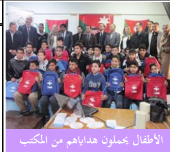
الأطفال يحملون هداياهم من المكتب

كجزء من حملة التوعية المستمرة بحقوق الطفل التي يقوم بها المكتب، والتي ابتدأها في تشرين الأول/أكتوبر ٢٠١٦، نظم المكتب وإدارة شرطة الأحداث ووفد الاتحاد الأوروبي في الأردن أكثر من ٧٥ زيارة للمدارس الابتدائية والثانوية في عمان ومدن أخرى. وقد شارك في المحاضرات أكثر من ٢٠٠٠ طالب وتلقوا مواد توعية لإعلامهم بحقوقهم. وتهدف حملة المكتب هذه إلى زيادة وعي الأطفال بحقوقهم القانونية والإجراء المتبعة في إطار نظام العدالة التصالحية للأطفال المخالفين للقانون، وإلى تهيئة بيئة ملائمة للأطفال في مراكز شرطة الأحداث في جميع أنحاء البلد، بما يتماشى مع المعايير الدولية. تمول الاتحاد الأوروبي هذا المشروع