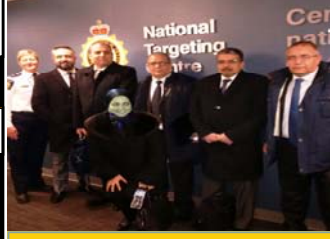
الوفد يزور "مركز الاستهداف"

في شهر آذار/مارس نظم المكتب جولة دراسية إلى كندا لوفد تونسي رفيع المستوى بغية تعريفه على الخبرة الكندية في إدارة وتحليل المخاطر على الحدود، بما في ذلك عملية التحليل والتنسيق والإدارة ونشر المعلومات على الوحدات الحدودية الميدانية. وشملت الجولة أيضا زيارة لمطار مونتريال الدولي للاطلاع على التنسيق والأثر الذي تحدته النتائج التي يبثها "مركز الاستهداف" إلى الوحدات التشغيلية على الحدود في ظروف التشغيل الفعلية. كما نوقشت برامج بشأن توحيد إجراءات الإدارة التشغيلية. تمول المشروع المملكة المتحدة وكندا واليابان