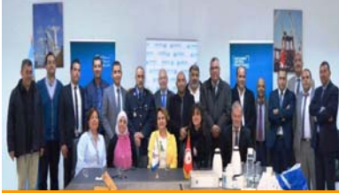
صورة جماعية في نهاية التدريب

قَدِّمَ المكتب ومنظمة الجمارك العالمية تدريبا عمليا لمدة أسبوعين في شباط/فبراير وآذار/مارس في ميناء راديس بتونس، تم خلاله بناء قدرات المسؤولين من الجمارك وشرطة الحدود، ومحطة الميناء، وهيئة ميناء راديس