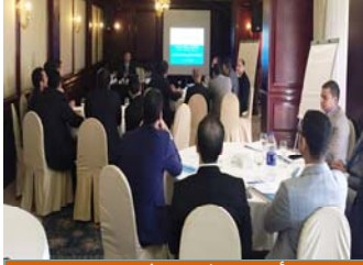
أعضاء النيابة المتدربون

عقد المكتب تدريبا في الأقصر في كانون الثاني/يناير لبناء قدرات ٢٠ عضوا من أعضاء النيابة وتدريبهم على معالجة قضايا العنف ضد المرأة. وقد استند التدريب إلى الدليل الإجرائي الصادر عن المكتب بعنوان "الاستجابة الفعالة لادعاء حيال العنف ضد المرأة". قَدِّمَ التدريب كبار المدَّعين العامين الذين سبق